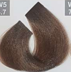
DARK CHOCOLATE BLONDE بلوند شکلاتی تیره اشقر شوکولاته غامق