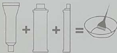
Mixing Normal Shades