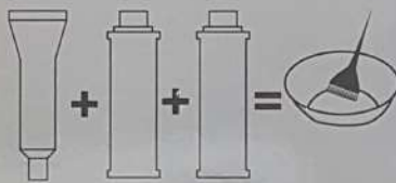
Mixing Super Lightenings

رنگ موی بدون آمونیاک کاترمر یک رنگ موی دائمی است که ضمن ایجاد تغییر رنگ دلخواه بر روی موها و پوشاندن کامل تارهای خاکستری، فاقد آمونیاک بوده و به دلیل پایین بودن pH به موها آسیب نمی رساند و ایجاد حساسیت نمی کند.