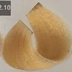
ROYAL BONY استخوانی رویال العنّام الملکیه