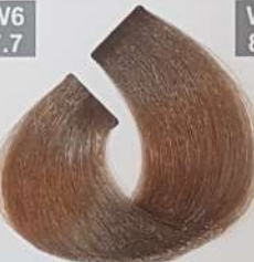
MEDIUM CHOCOLATE BLONDE بلوند شکلاتی متوسط اشقر شوکولاته وسط