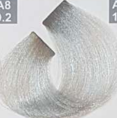
EXTRA LIGHT ASH BLONDE بلوند خاکستری خیلی روشن اشقرمادی فاتح جدا