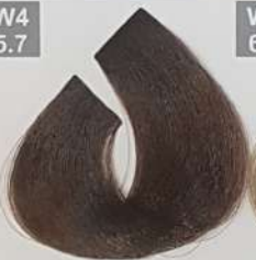
LIGHT CHOCOLATE BROWN قهوه‌ای شکلاتی روشن بسی شوکولاته فاتح