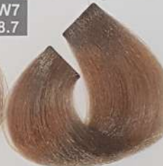
LIGHT CHOCOLATE BLONDE بلوند شکلاتی روشن اشقر شوکولاته فاتح