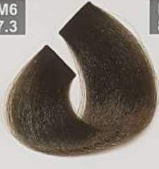
MEDIUM MATT BLONDE بلوند زیتونی متوسط اشقرماتل لایزونی وسط