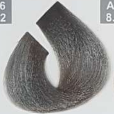
MEDIUM ASH BLONDE بلوند خاکستری متوسط اشقرمادی وسط