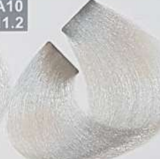
PLATINUM ASH BLONDE بلوند خاکستری پلاتینه اشقرمادی پلاتینی