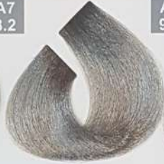
LIGHT ASH BLONDE بلوند خاکستری روشن اشقرمادی فاتح