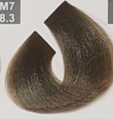
LIGHT MATT BLONDE بلوند زیتونی روشن اشقر ماتل لایزونی جدا فاتح