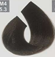
LIGHT MATT BROWN قهوه‌ای زیتونی روشن بسی ماتل لایزونی فاتح