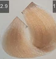
PEARL مرواریدی الؤلر