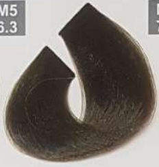
DARK MATT BLONDE بلوند زیتونی تیره اشقرماتل لایزونی غامق