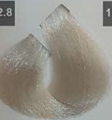
CRYSTAL B LONDE بلوند کریستالی اشقرکریستال