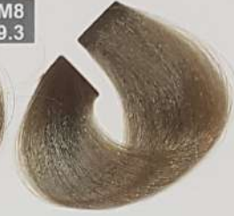
EXTRA LIGHT MATT BLONDE بلوند زیتونی خیلی روشن اشقر ماتل لایزونی جدا فاتح