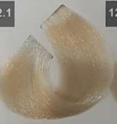
ACTIVE SILVER نقره‌ای اکتیو فضی الفعّال